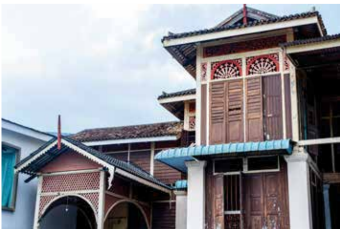
Jalan Haji Ahmad Said, Bagan Luar, 12200 Butterworth, Penang.

北海青年独立广场于殖民时期被称为英国休闲俱乐部 (BRITISH RECREATION CLUB (BRC))。该地记录了自独立活动开始以来的各种历史与过往事件。