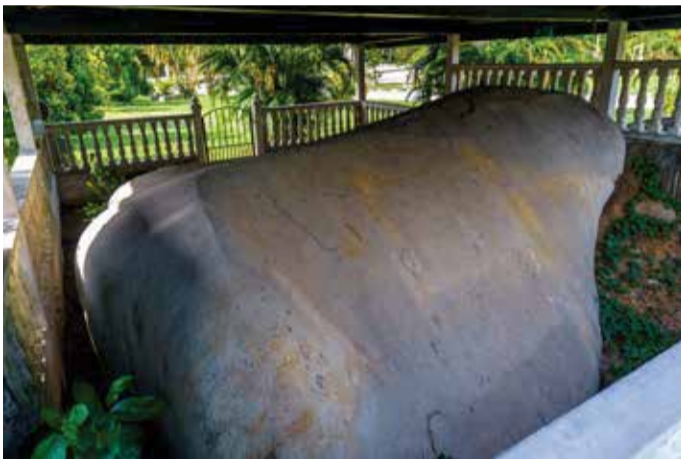
Kampong Kota, Permatang Pasir, Penang.

吉打皇陵是吉打的马来苏丹国重要遗产的一部分。这座陵墓由 ALMARHUM TUNKU SULAIMAN IBNI ALMARHUM SULTAN ABDULLAH MUKARRAM SHAH 在1821年以前建立。1821年11月12日，来自LIGUR的暹罗舰队入侵并攻下了吉打。当时的吉打苏丹 AHMAD TAJUDDIN HALIM SHAH II 从他位于迪加岛的住处逃到了陵墓这里，并被他的弟弟TUNKU SULAIMAN救出，之后前往檳城寻求英国人的保护。后来，这个区域被英国人指定成为皇陵保留地。