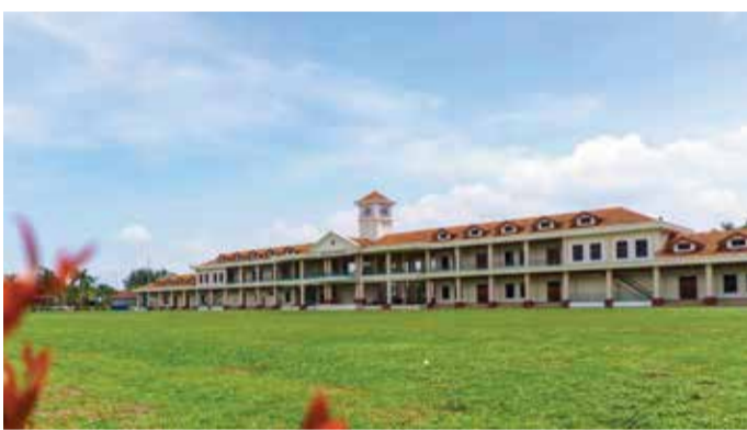
Jalan Kulim, 14000 Bukit Mertajam, Penang.