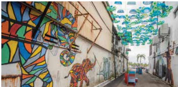
British-Siamese Boundary Stone, 09400 Penang.

英国暹罗边界石静静伫立于威省北部檳榔东海的偏远旷野，曾一度用来标示英国殖民地与暹罗王朝领土的边界线。1869年，双方签订了条约之后，在此处设立了这块石碑。当时，檳城受英国管辖；吉打则归暹罗统治。