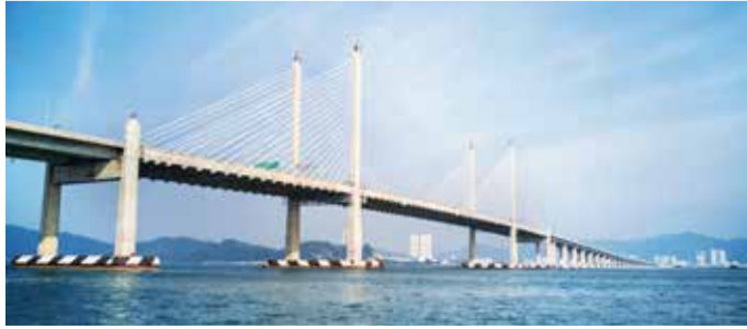
Jambatan Merdeka, Bumbong Lima, 13200 Kepala Batas, Penang.

独立铁桥位于吉打和檳城的边界。这座铁桥在1957年完工，用以取代原来在1940年建成、1942年遭日本军队摧毁的旧桥。当时，由马来西亚的第一任首相东姑阿都拉曼主持通车仪式，因适逢马来西亚独立，因此将之命名为独立铁桥。此桥横跨姆达河，连接起吉打州和威省，为重要的交通枢纽。