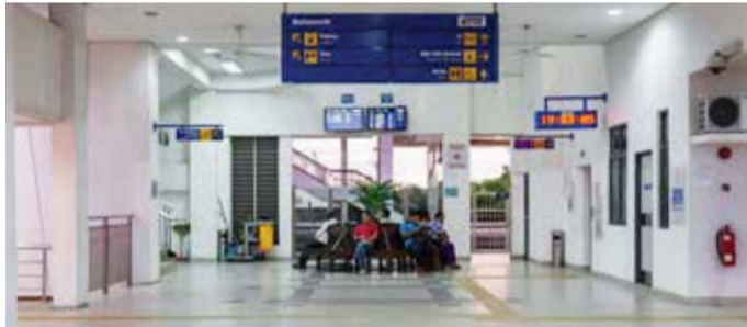
1, Lorong Bagan Luar 1, Bagan Luar, 12000 Butterworth, Penang.

檳岛的街头艺术潮流兴起之后，北海也赶上这股风潮，打造出充满壁画、涂鸦的北海艺术画廊。这些引人注目的壁画与设计饱含檳城丰富的历史文化元素，游客在探索并欣赏艺术的同时，正好也可以一窥当地过往的繁华风貌。