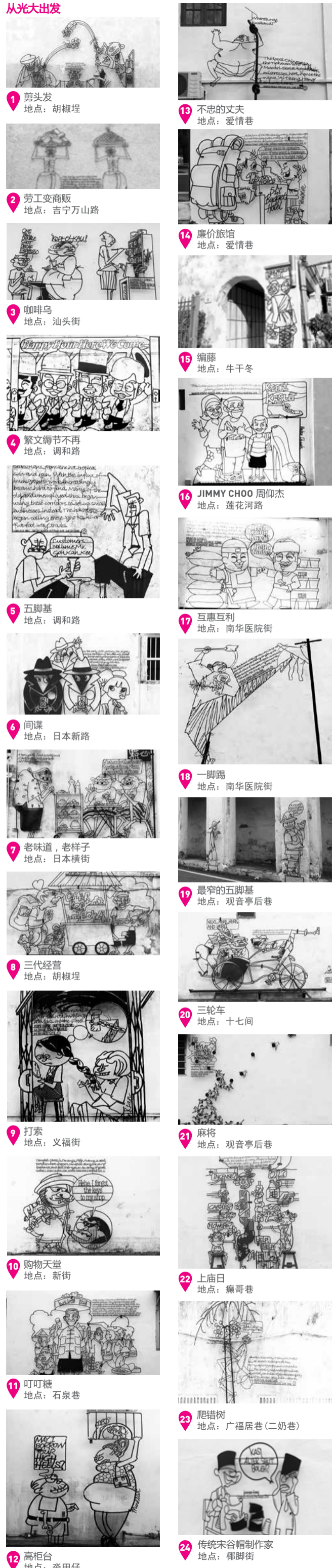
1 剪头发 地点: 胡椒埕 2 劳工变商贩 地点: 吉宁万山路 3 咖啡乌 地点: 汕头街 4 繁文缛节不再 地点: 调和路 5 五脚基 地点: 调和路 6 间谍 地点: 日本新路 7 老味道, 老样子 地点: 日本横街 8 三代经营 地点: 胡椒埕 9 打索 地点: 义福街 10 购物天堂 地点: 新街 11 叮叮糖 地点: 石泉巷 12 高柜台 地点: 普田仔 13 不忠的丈夫 地点: 爱情巷 14 廉价旅馆 地点: 爱情巷 15 编藤 地点: 牛干冬 16 JIMMY CHOO 周仰杰 地点: 莲花河路 17 互惠互利 地点: 南华医院街 18 一脚踢 地点: 南华医院街 19 最窄的五脚基 地点: 观音亭后巷 20 三轮车 地点: 十七间 21 麻将 地点: 观音亭后巷 22 上庙日 地点: 麻哥巷 23 爬墙树 地点: 广福居巷(二奶巷) 24 传统宋谷帽制作者 地点: 椰脚街