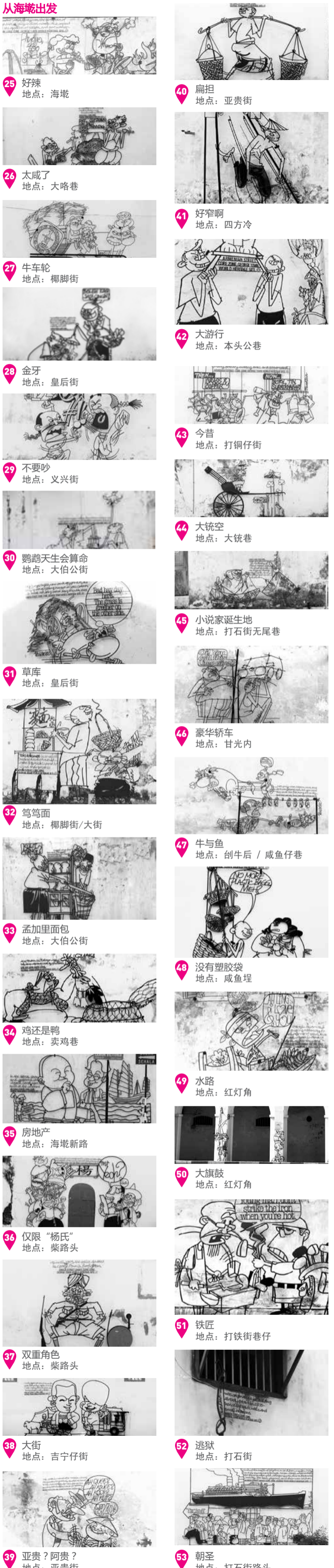
25 好辣 地点: 海墘 26 太咸了 地点: 大略巷 27 牛车轮 地点: 椰脚街 28 金牙 地点: 皇后街 29 不要吵 地点: 义兴街 30 骑鹤天生会算命 地点: 大伯公街 31 草库 地点: 皇后街 32 笃笃面 地点: 椰脚街/大街 33 笃笃面包 地点: 大伯公街 34 鸡还是鸭 地点: 卖鸡巷 35 房地产业 地点: 海墘新路 36 仅限“杨氏” 地点: 柴路头 37 双重角色 地点: 柴路头 38 大街 地点: 吉宁仔街 39 亚贵? 阿贵? 地点: 亚贵街 40 扁担 地点: 亚贵街 41 好窄啊 地点: 四方冷 42 大游行 地点: 本头公巷 43 今昔 地点: 打铜仔街 44 大铁空 地点: 大铁巷 45 小说家诞生地 地点: 打石街无尾巷 46 豪华轿车 地点: 甘光内 47 牛与鱼 地点: 创牛后 / 威鱼仔巷 48 没有塑胶袋 地点: 咸鱼埕 49 水路 地点: 红灯角 50 大旗鼓 地点: 红灯角 51 铁匠 地点: 打铁街巷仔 52 逃狱 地点: 打石街 53 朝圣 地点: 打石街路头