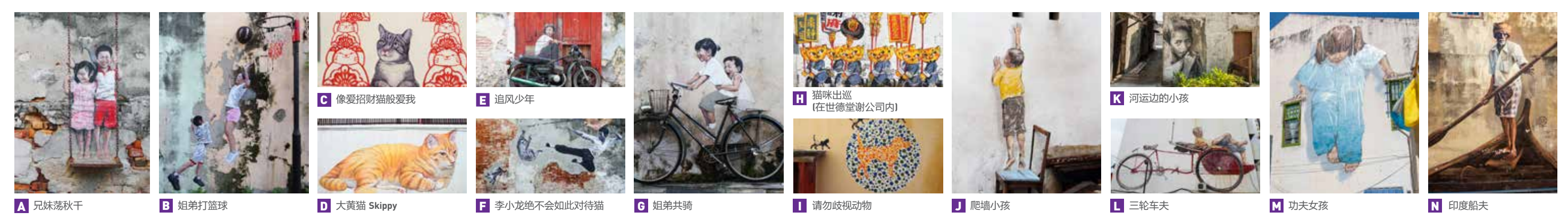
A 兄妹荡秋千 B 姐弟打篮球 C 爱像招财猫般爱我 E 追风少年 F 李小龙绝不会如此对待猫 G 姐弟共骑 H 猫咪出巡 (在世德堂谢公司内) I 请勿欺凌动物 J 爬墙小孩 K 河运边的小孩 L 三轮车夫 M 功夫女孩 N 印度船夫